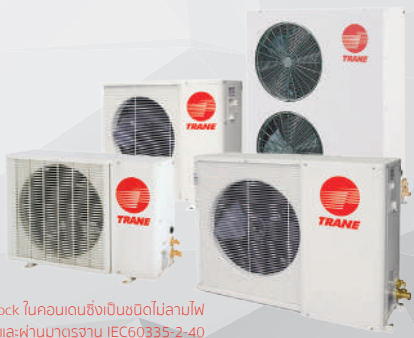
Terminal Block ในคอนเดนซิ่งเป็นชนิดไม่ลามไฟ และผ่านมาตรฐาน IEC60335-2-40

แทรน เครื่องหมายผลิตภัณฑ์สินค้าคุณภาพที่ได้รับการรับรองคุณภาพตามระบบมาตรฐานสากล ISO9001:2008 ซึ่งเป็นการรับรองว่าเครื่องปรับอากาศแทรนเป็นที่เชื่อถือได้ ผลิตตามมาตรฐานสากล มีคุณภาพมาตรฐานการส่งออก พร้อมมีมาตรฐานความเย็นแบบเต็มมีทิว และยังได้รับมาตรฐานผลิตภัณฑ์อุตสาหกรรม มอก.2134-2553 จากสำนักงานมาตรฐานผลิตภัณฑ์อุตสาหกรรม คุณจึงมั่นใจได้ว่า เครื่องปรับอากาศแบบตั้งแขวนแทรน NewStylus สามารถตอบสนองความเย็นสบายได้อย่างเต็มประสิทธิภาพ